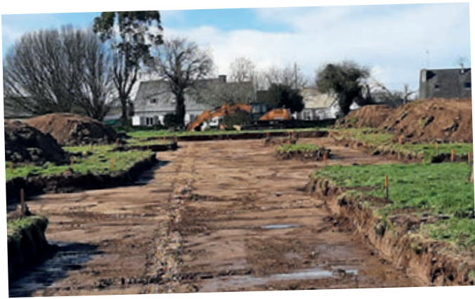
Terrassement du nouveau lotissement de Mabiliès