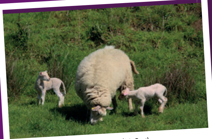
Deux des agneaux nés cette année (M. Prat)