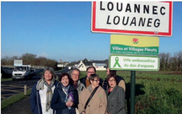
Ville ambassadrice du don d'organe