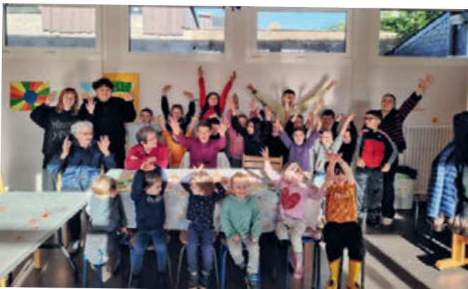
Les résidents de l'EHPAD se déplacent au centre de loisirs