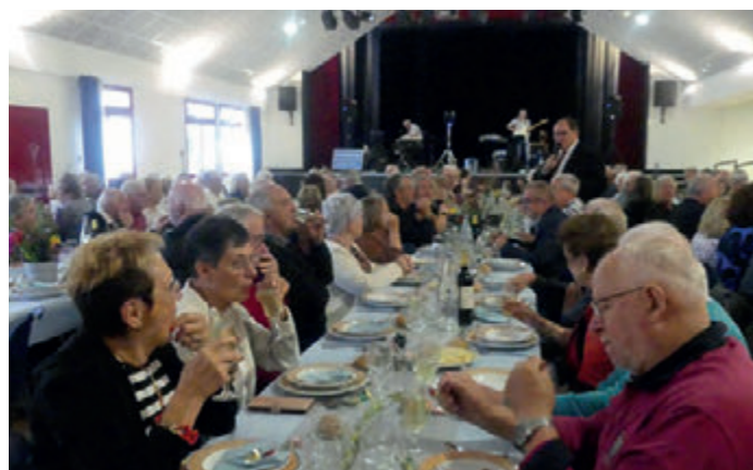
Repas des anciens