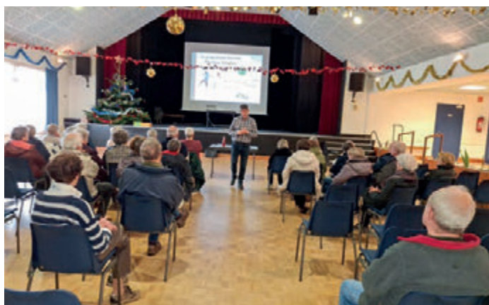
Conférence Activités Physique Adaptées