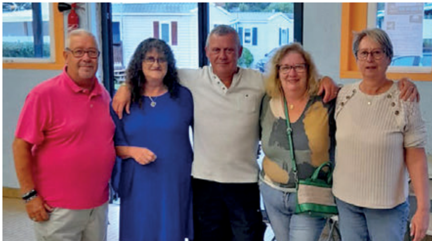
L'équipe permanente du camping.