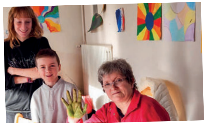
Centre de loisirs, atelier peinture avec les résidents de l'EHPAD