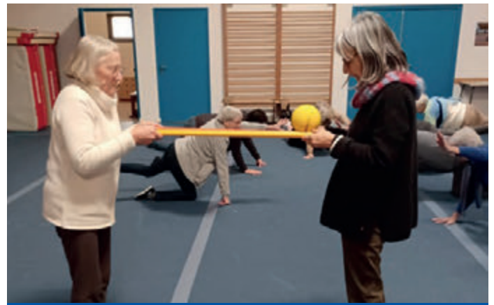
Des ateliers Préventions des chutes