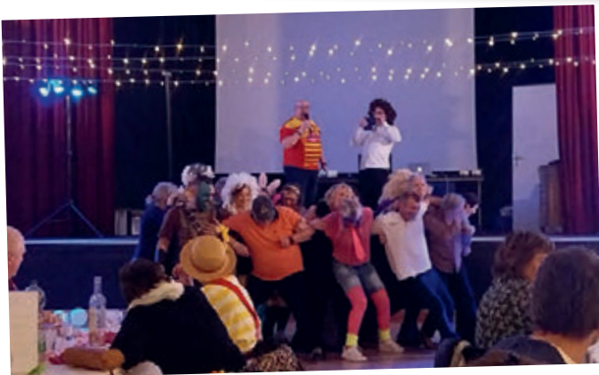
Le chahut à la soirée ch'ti