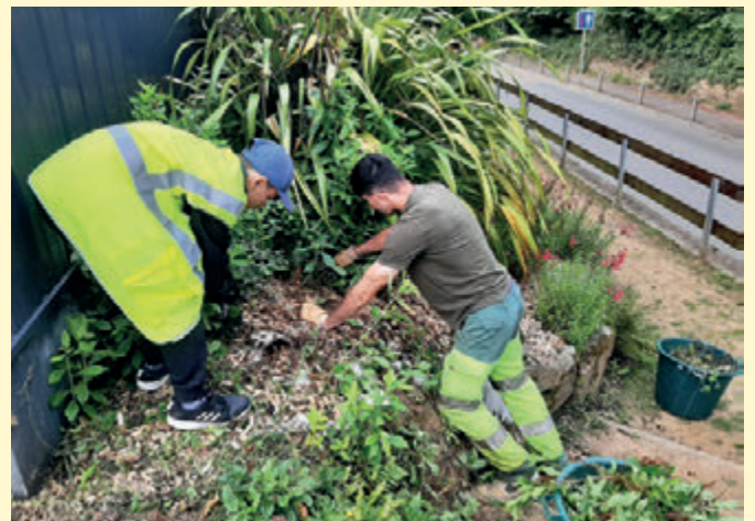
84 missions argent de poche en 2024.