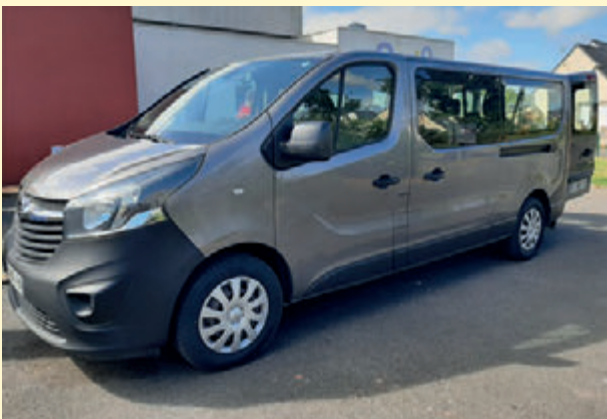
Le nouveau minibus communal.