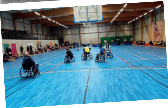
La Loupentreker démo handisport