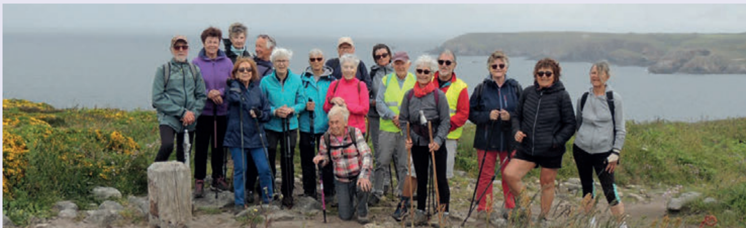
Pour la première fois à l'ARAL, 23 randonneurs ont participé à un séjour, en mai, à Douarnenez. Entre marche sur le GR (photo) parfois accidenté, découverte de magnifiques paysages et visites, tout le monde est rentré satisfait de cette semaine. En mai, nous serons 21 à partir découvrir les Mystères de Brocéliande.