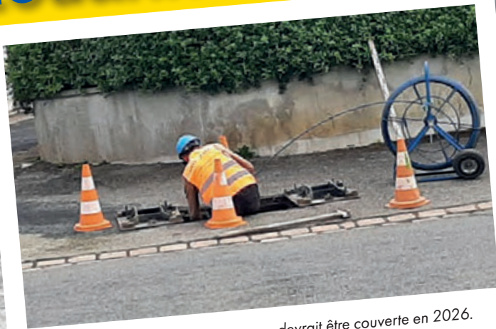
Passage de la fibre. Toute la commune devrait être couverte en 2026.