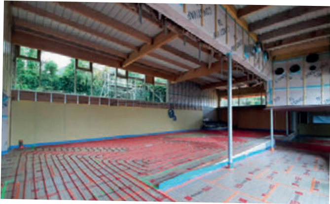
Pose du plancher chauffant dans la médiathèque