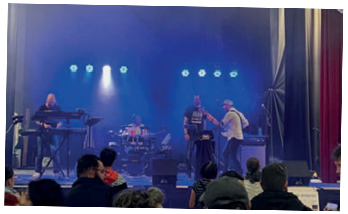
Fête de la musique au foyer