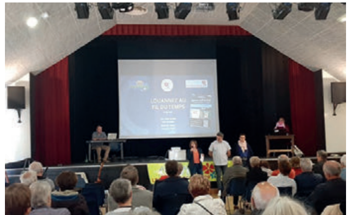
Conférence au fil du temps