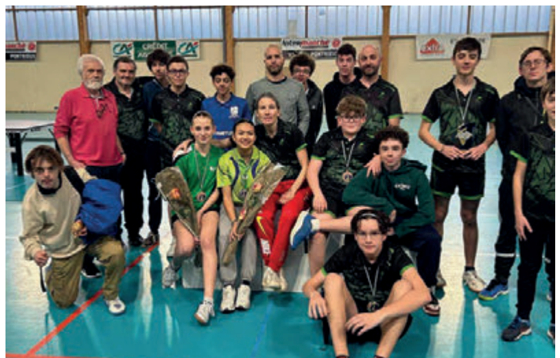
les participants aux finales départementales par classements