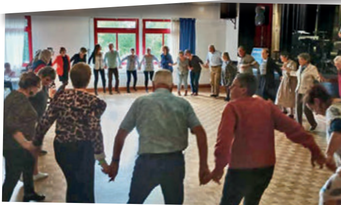
Ca danse au repas des anciens