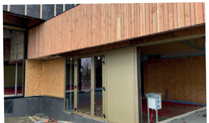
La future porte d'entrée de la médiathèque