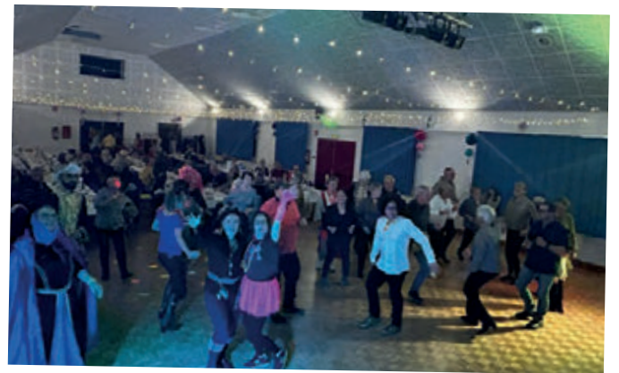
Soirée Ch'ti organisée par les commerçants