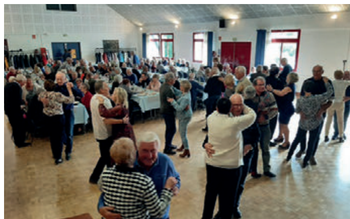
Repas des anciens