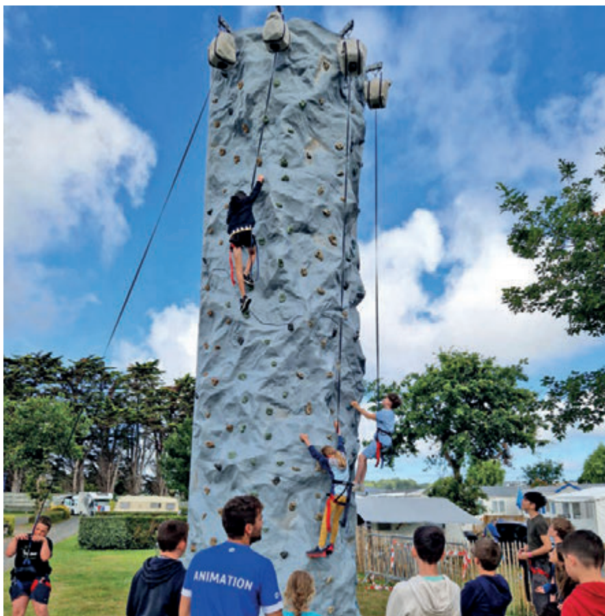
Animation escalade pour les jeunes vacanciers.