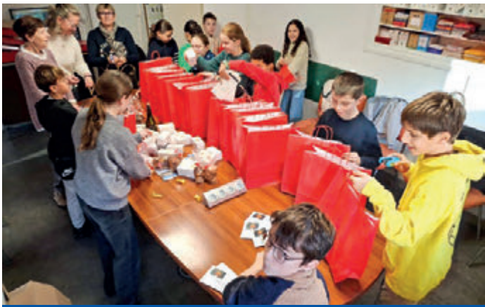
Réalisation des colis de Noël