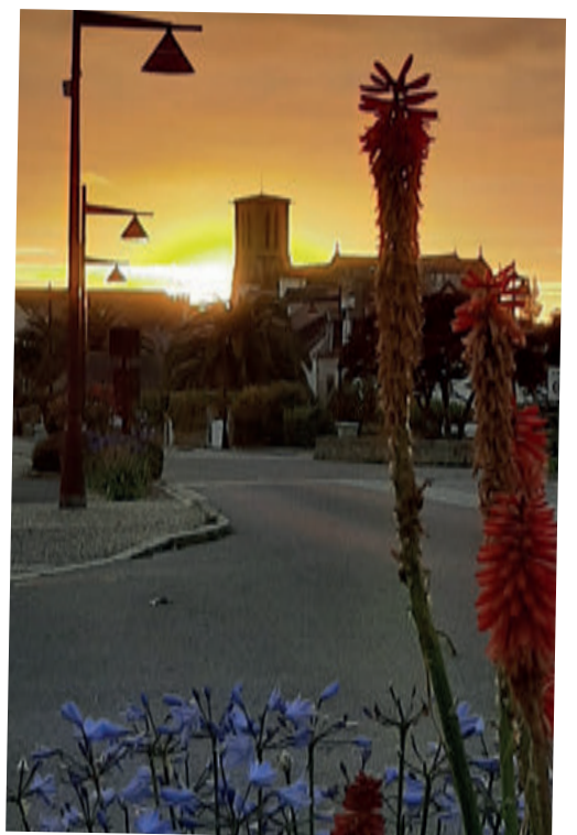
Coucher de soleil sur l'église (E. Cogneau)