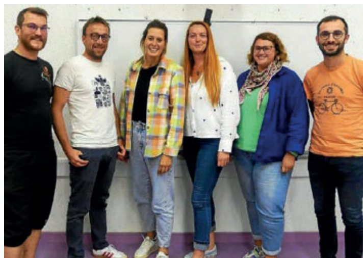
L'équipe du CAEL.