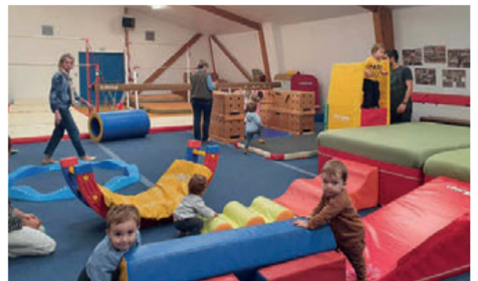
Baby-gym, de futurs sportifs