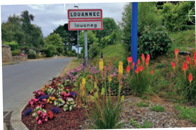
Entrée de bourg (M. Prat)