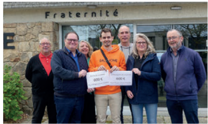
Remise de chèque pour l'Espoir d'une tripléte