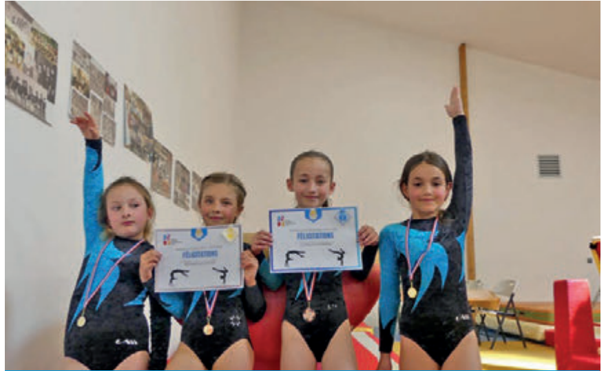
Pousines médaillées des badges