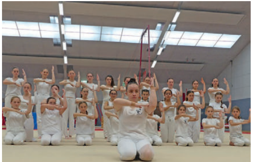
Gala Park Nevez, juin 2024