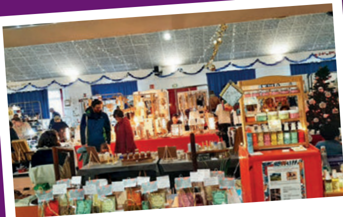
Marché de Noël 2024