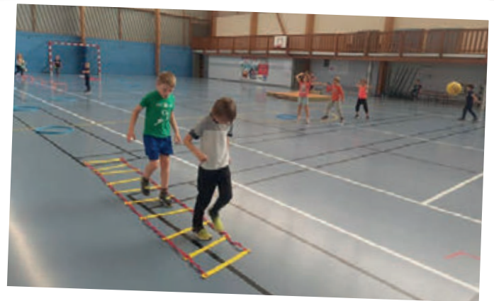
L'école des sports