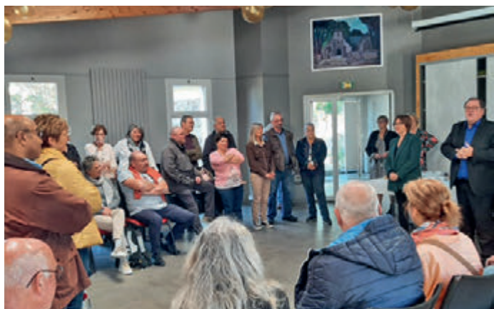
Accueil des nouveaux louannécains